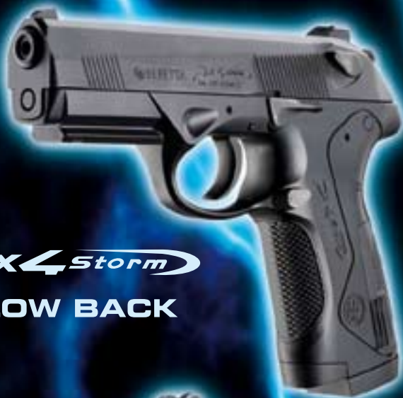
Px4 Storm BLOW BACK