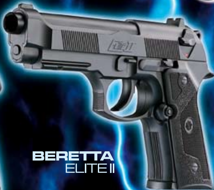
BERETTA ELITE II