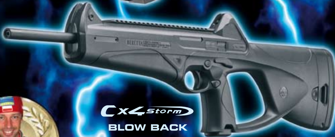
Cx4 Storm BLOW BACK